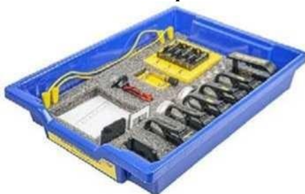
Рис. 7. Комплект сопутствующих элементов для экспериментов по оптике В

Комплект сопутствующих элементов для экспериментов по оптике (рис. 7).