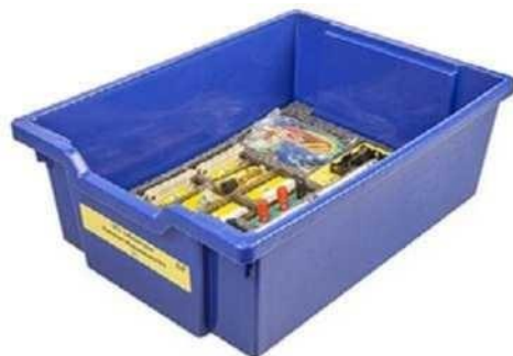
Рис. 6. Комплект сопутствующих элементов для экспериментов по электродинамике

Комплект сопутствующих элементов для экспериментов по электродинамике (рис. 6).