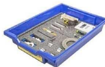
Набор № 4