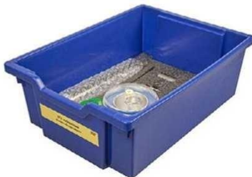
Рис. 5. Комплект сопутствующих элементов для экспериментов по молекулярной физике

Комплект сопутствующих элементов для экспериментов по молекулярной физике (рис. 5).