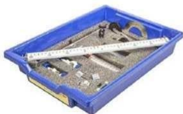
Набор № 3