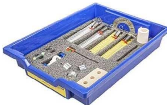
Набор № 2