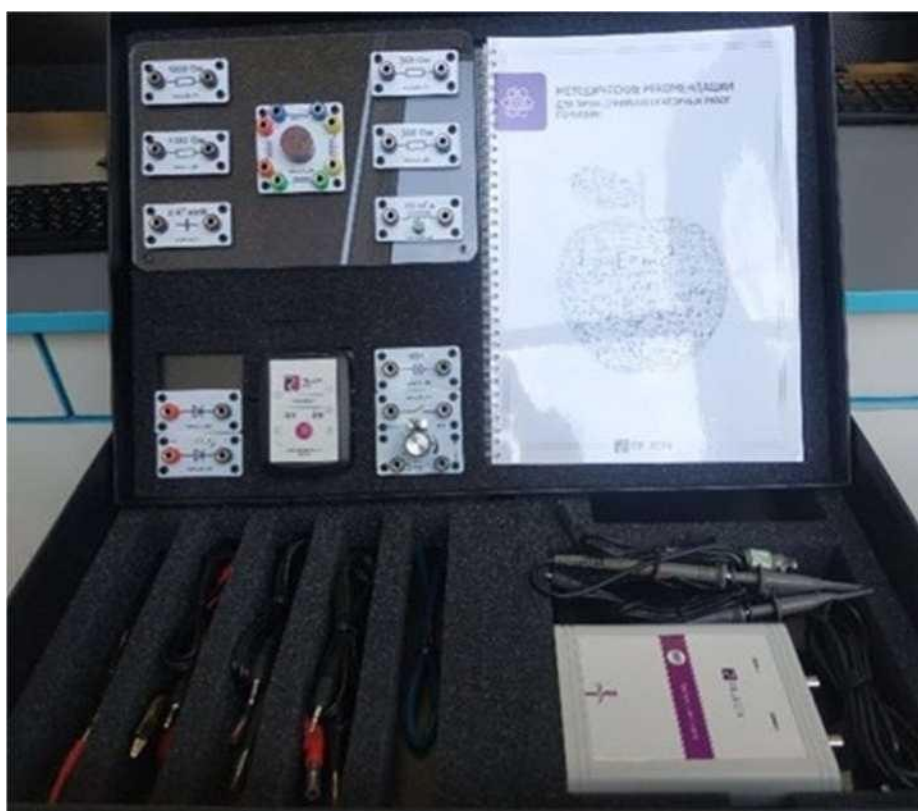
Рис. 1. Цифровая лаборатория по физике

Датчик (рис. 2) производит измерения абсолютного давления. Чувствительный элемент датчика выполнен на базе монолитного кремниевого пьезорезистора с внедрённой тензочувствительной структурой, которая позволяет исключить возможные погрешности и достигнуть необходимой точности измерений. В комплект датчика абсолютного давления входит гибкая герметичная трубка для подключения штуцера датчика к лабораторному оборудованию.