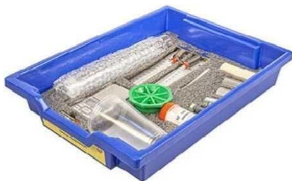
Набор № 1