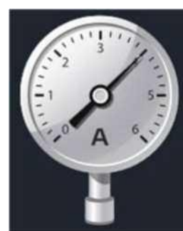
Рис. 2. Датчик абсолютного давления